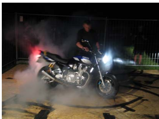
Burn out plattan