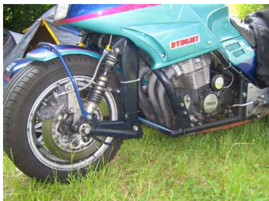
Detaljer på XJR med sidvagn