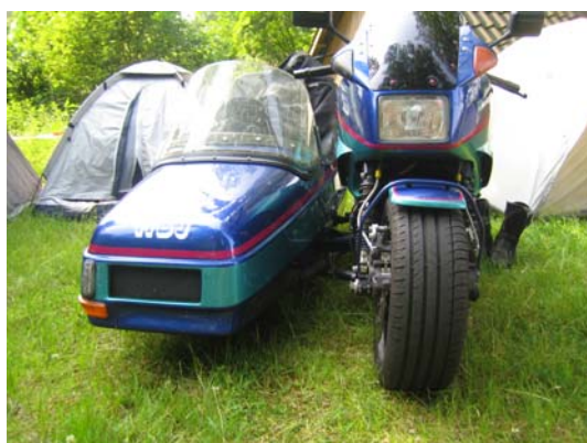
XJR med sidvagn