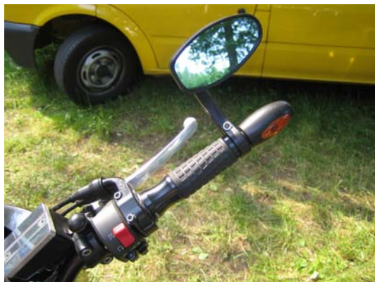
Backspegel och blinkers