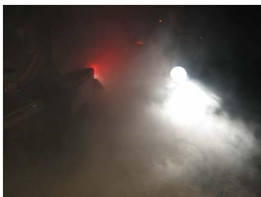
Burn out plattan