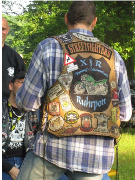
XJR förare från Ruhrpott